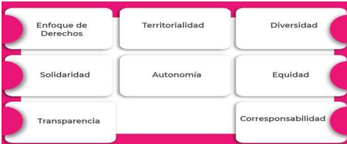
Imagen 1. Principios de la PPSS.

Se desarrollan a su vez, los principios de la PPSS, para el cual el MSPS, establece: La garantía de la participación social respecto del derecho fundamental a la salud que se desarrolla mediante la PPSS se fundamenta en los siguientes principios: