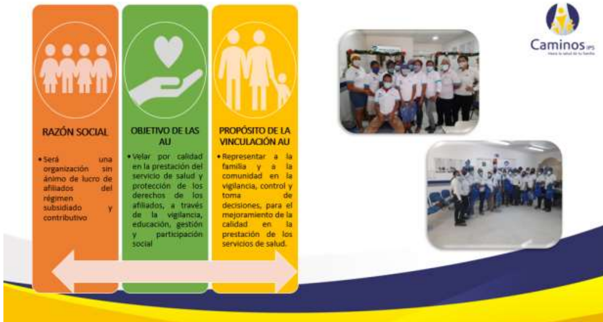
Imagen 3. Objetivos de la Alianza de Usuarios.

Así mismo, se detallan generalidades de la Alianza de Usuarios, su relevancia en la toma de decisiones para la organización, así como los retos y desafíos que se tejen como responsables de la protección y defensa del usuario, así como en los componentes de educación, información permanente y la participación. Así mismo se desarrolla el objetivo de la Alianza, la cual propenderá por la vigilancia en la calidad de los servicios y la defensa de los derechos de los usuarios de los servicios de salud.