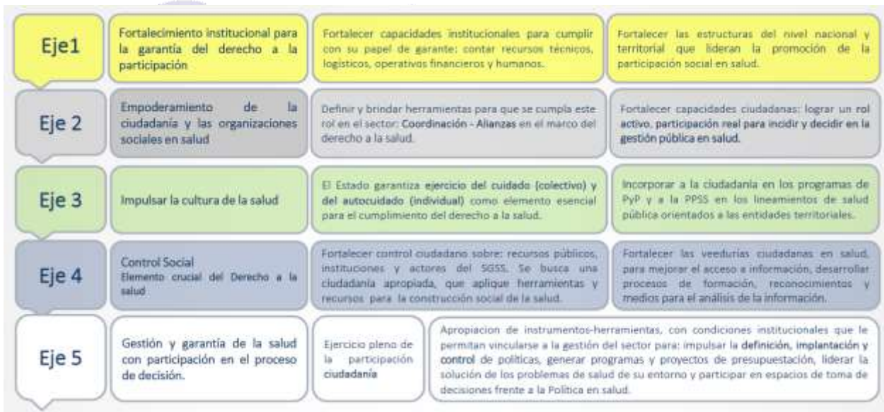
Imagen 2. Ejes y líneas estratégicas de la PPSS.

A continuación se presentan los ejes estratégicos para el logro de los objetivos propuestos, éstos se constituyen en las líneas maestras de intervención sistemática, para el desarrollo de la PPSS. Los ejes estratégicos se agrupan en una serie de nudos problemáticos, de acuerdo con los cuales se definen las acciones a desarrollar. Estos son: