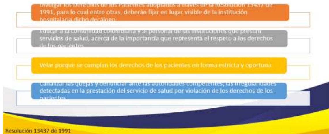
Imagen 6 6. Funciones del Comité de Ética Médica - Resolución 13437 de 1991 del MSPS.