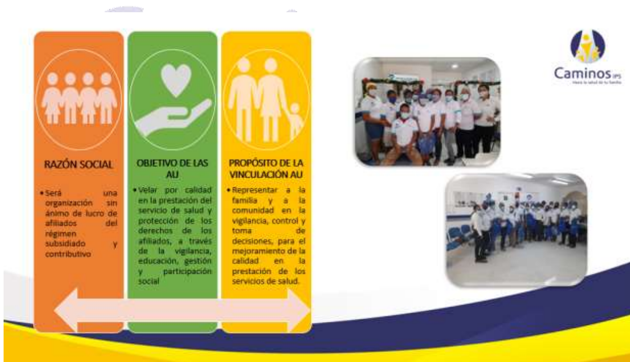
Imagen 2. Objetivos de la Alianza de Usuarios.

Así mismo, detallan generalidades de la Alianza de Usuarios, su relevancia en la toma de decisiones para la organización, así como los retos y desafíos que se tejen como responsables de la protección y defensa del usuario, así como en los componentes de educación, información permanente y la participación. Así mismo se desarrolla el objetivo de la Alianza, la cual propenderá por la vigilancia en la calidad de los servicios y la defensa de los derechos de los usuarios de los servicios de salud.