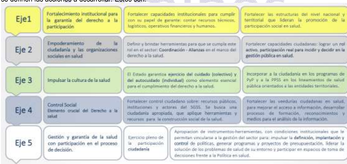
Imagen 1. Ejes y líneas estratégicas de la PPSS.

A continuación, se presentan los ejes estratégicos para el logro de los objetivos propuestos, éstos se constituyen en las líneas maestras de intervención sistemática, para el desarrollo de la PPSS. Los ejes estratégicos se agrupan en nudos problemáticos, según los cuales se definen las acciones a desarrollar. Estos son: