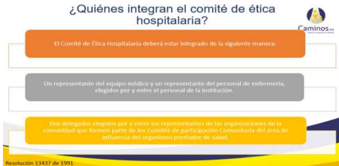
Imagen 42. Integrantes del Comité de Ética Médica - Resolución 13437 de 1991 del MSPS.

CaminoS IPS SAS, además de la Alianza de Usuarios, genera acciones de planeación e intervención destinadas a cumplir con los ejes y líneas de acción de la PPSS, granizando desde un enfoque de derechos, la solidaridad, territorialidad, diversidad, autonomía, equidad, y transparencia como principios básicos del ejercicio. Así mismo, dentro del componente de participación se incluye el Comité de Ética Médica, como herramienta que contribuye al abordaje integral de las situaciones donde se pueda identificar algún tipo de vulneración en la prestación de los servicios que ofrece la organización, generando estrategias de intervención oportunas y sostenibles en el tiempo. Por ello se socializan las generalidades, marco normativo, objetivos, integrantes y su periodicidad: