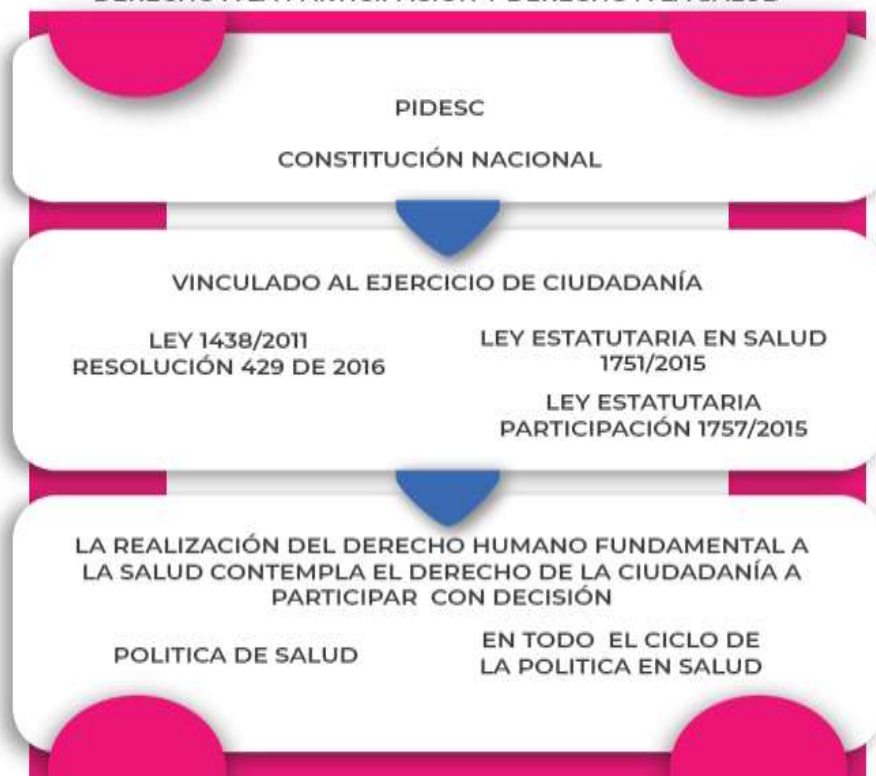
Gráfico 3: NORMAS QUE SUSTENTAN LA CONCEPCIÓN DE DERECHO A LA PARTICIPACIÓN Y DERECHO A LA SALUD

Marco Normativo: En este ítem, se desarrolla y se detalla las normas y marco jurídico reglamentario en los que se soporta la Política de Participación Social en Salud, la necesidad emergente de su implementación y los actores participantes según la legislación.