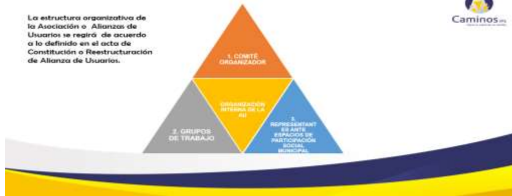
Imagen 3. Estructura organizativa de las Alianzas de Usuarios.

A continuación se desglosa la estructura organizativa e la Alianza de usuarios, según lo definido en el acta de conformación de la misma,